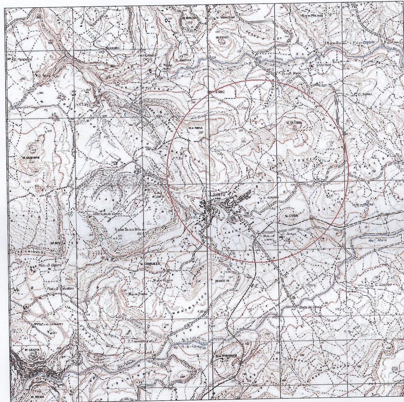
Staricio IGM 25:000 - Foglio 442150 - Laerru